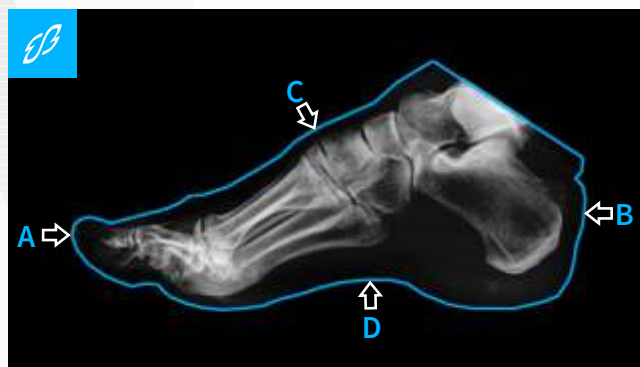
POINTURE CHAUSSURE DE VILLE